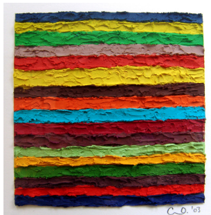
Carlos Estrada-Vega (USA), Mischtechnik auf Papier, 2003. 23 x23 cm (SFr. 2200.-)