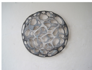
Ute Haecker (D) „Planet“, 2010. Acryl auf Holz- 73 x 73 cm. (SFr. 4000.-)